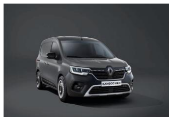
URBAN GRÅ (KPW)