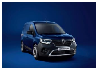
CANVASIT BLÅ (RQV)