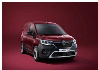
CARMINE RØD (NPF)