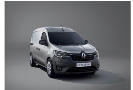
HIGHLAND GRÅ (KQA)