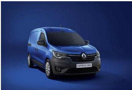
IRON BLUE (RQH)