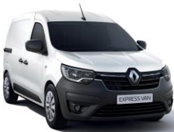
HVIT "GLACIER" (369)