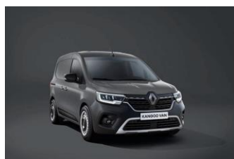
URBAN GRÅ (KPW)