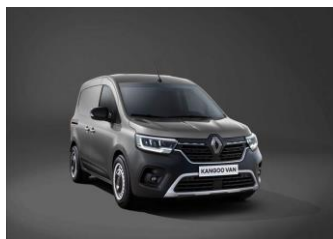
CASSIOPEE GRÅ [KNG]