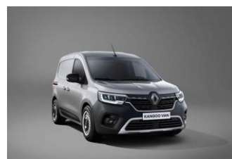
HIGHLAND GRÅ (KQA)