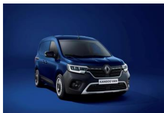
CANVASIT BLÅ (RQV) KOMMER!