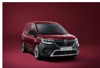
CARMINE RØD (NPF) Metallik lakk