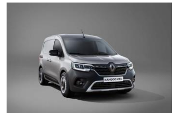
HIGHLAND GRÅ (KQA) Metallik lakk