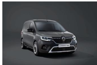
URBAN GRÅ (KPW) Solid lakk