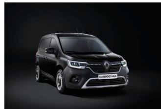
SORT (GNE) Metallik lakk