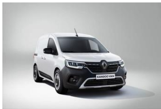
HVIT (QNG) Solid lakk