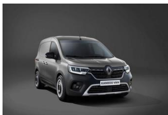
CASSIOPEE GRÅ (KNG) Metallik lakk