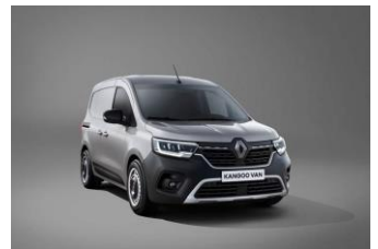
HIGHLAND GRÅ (KQA)