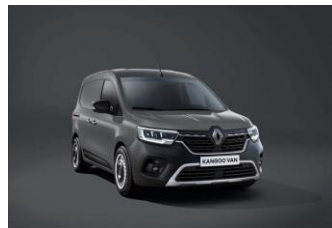
URBAN GRÅ (KPW)