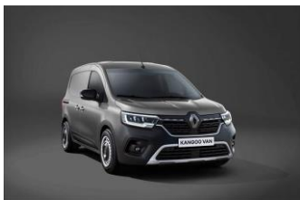
CASSIOPEE GRÅ [KNG]