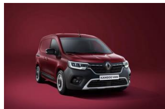
CARMINE RØD (NPF)