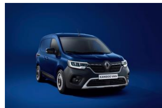
CANVASIT BLÅ [RQV]

Samtlige priser er anbefalte priser. Vi forbeholder oss retten til når som helst og uten forvarsel å kunne forandre gjeldende priser og spesifikasjoner. Det er gjort tor at innholdet i denne publikasjon skal være korrekt og å jour på datoen da den gikk i trykken. Med forbehold om skrivefeil. www.renault.no