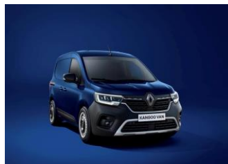
CANVASIT BLÅ (RQV)