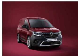
CARMINE RØD (NPF)