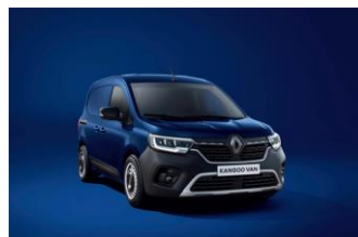
CANVASIT BLÅ (RQV)