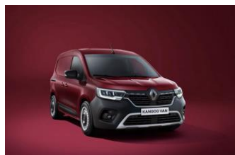
CARMINE RØD (NPF)