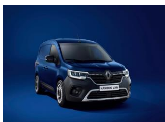
CANVASIT BLÅ (RQV)