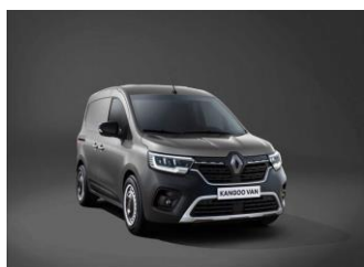
CASSIOPEE GRÅ (KNG)