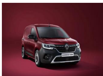
CARMINE RØD (NPF)