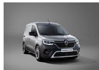
HIGHLAND GRÅ (KQA)