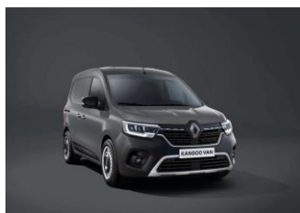
URBAN GRÅ (KPW)