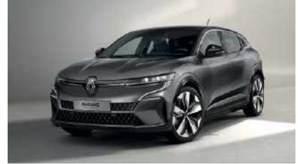
Grå Schiste (M)