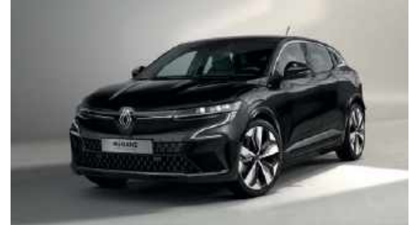
Sort Stjerne (M)

S: standard lakk. P: perlemoreffekt. M: metallic lakk. Bildene er kun til illustrasjonsformål.