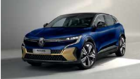
Blå Nocturne (M)