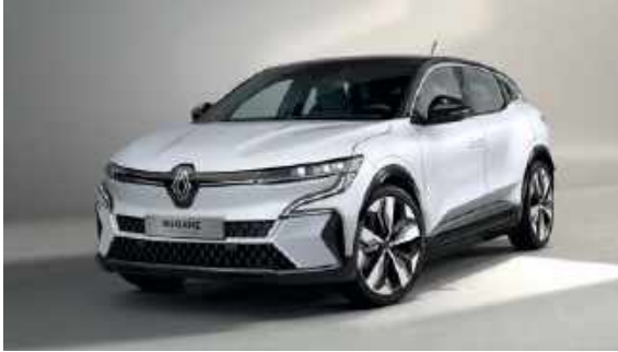
Hvit Glacier (S)