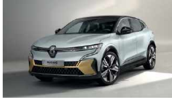
Grå Rafale (P)