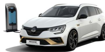
369 - Hvit "Glacier" (2)

(1) metallic lakk (2) standard lakk Fargene på bildene kan avvike fra virkeligheten.