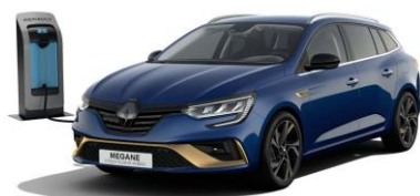
RQH - Blå "Iron" (1)