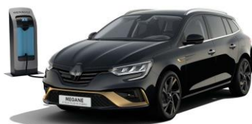
GNE - Sort "Stjerne" (1)