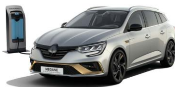
KQA - Grå "Highland" (1)