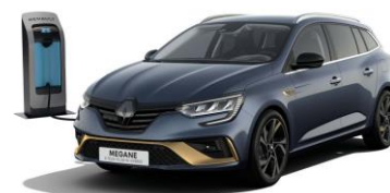
KPN - Grå "Titanium" (1)