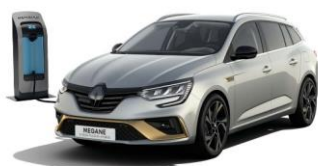
KQA - Grå "Highland" (1)