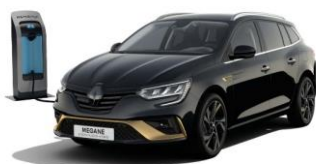
GNE - Sort "Stjerne" (1)