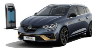
KPN - Grå "Titanium" (1)