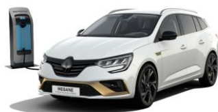
369 - Hvit "Glacier" (2)