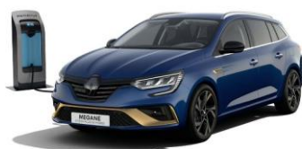
RQH - Blå "Iron" (1)