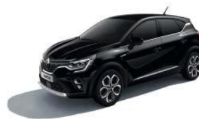
Sort "Étoile" (1)