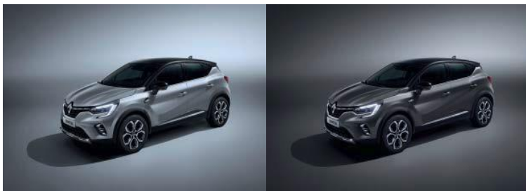
Grå "Highland" (1) m/sort tak