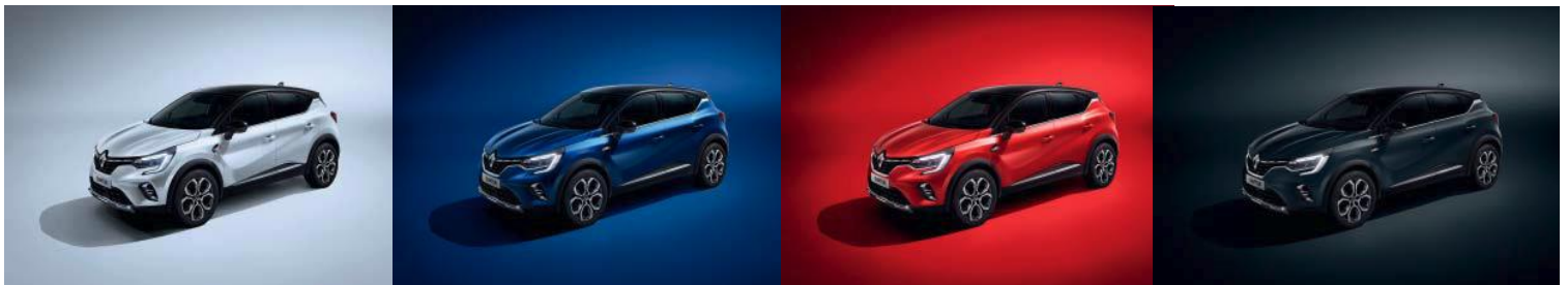
Hvit "Nacre" (1) m/sort tak