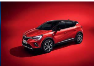
Rød "Flamme" m/ sort tak