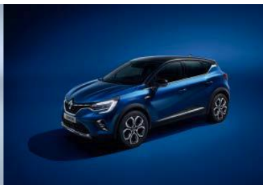
Blå "Iron" (1) m/ sort tak