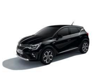
Sort "Étoile" (1)