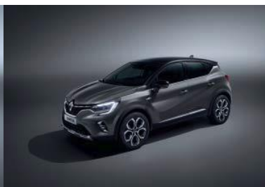
Grå "Cassiopee" (1) / Grå "Cassiopee" m/ sort tak