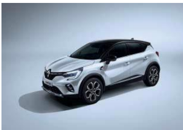
Hvit "Nacre" (1) m/sort tak