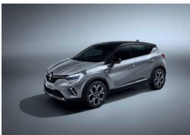
Grå "Highland" (1) m/sort tak