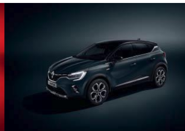
Blå "Marine Fumé" m/sort tak (2)